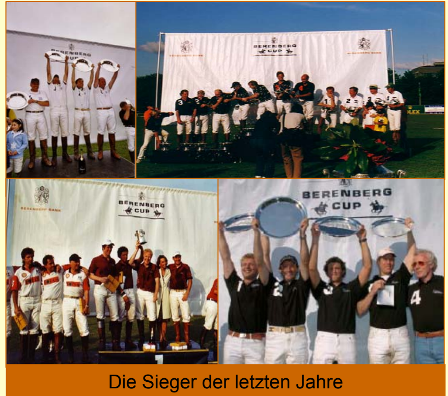
Die Sieger der letzten Jahre